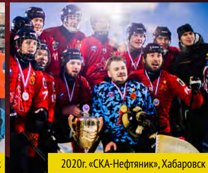
2020г. «СКА-Нефтяник», Хабаровск