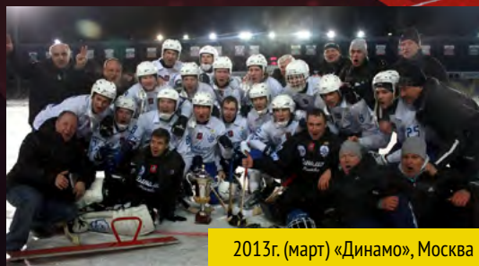
2013г. (март) «Динамо», Москва