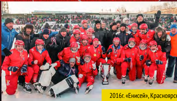
2016г. «Енисей», Красноярск