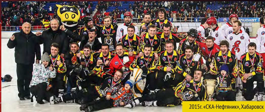
2015г. «СКА-Нефтяник», Хабаровск