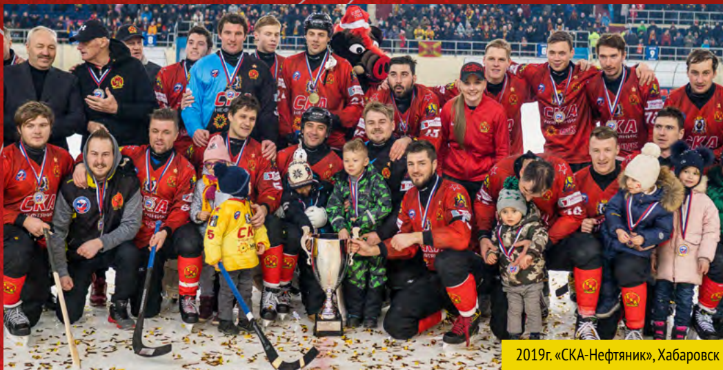
2019г. «СКА-Нефтяник», Хабаровск