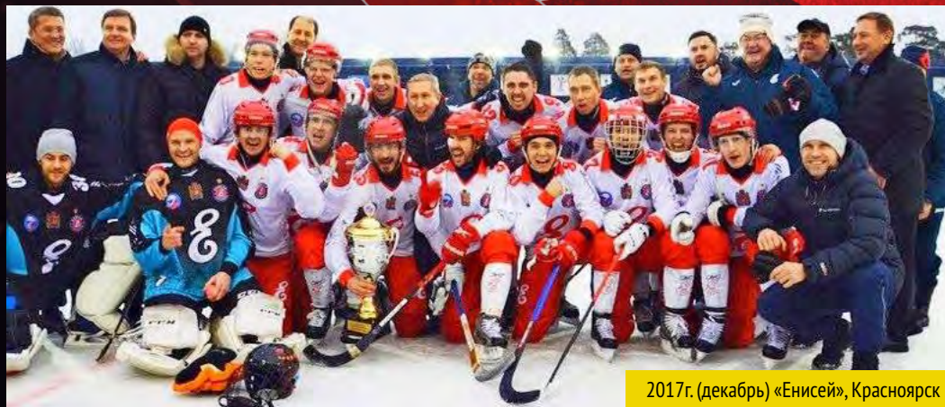
2017г. (декабрь) «Енисей», Красноярск