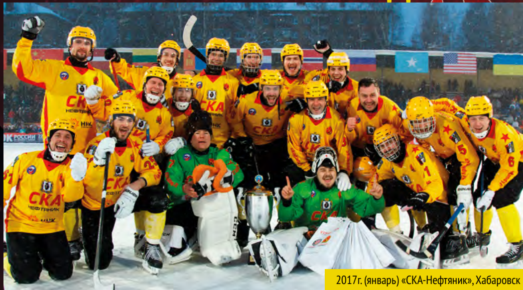
2017г. (январь) «СКА-Нефтяник», Хабаровск