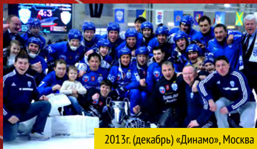
2013г. (декабрь) «Динамо», Москва